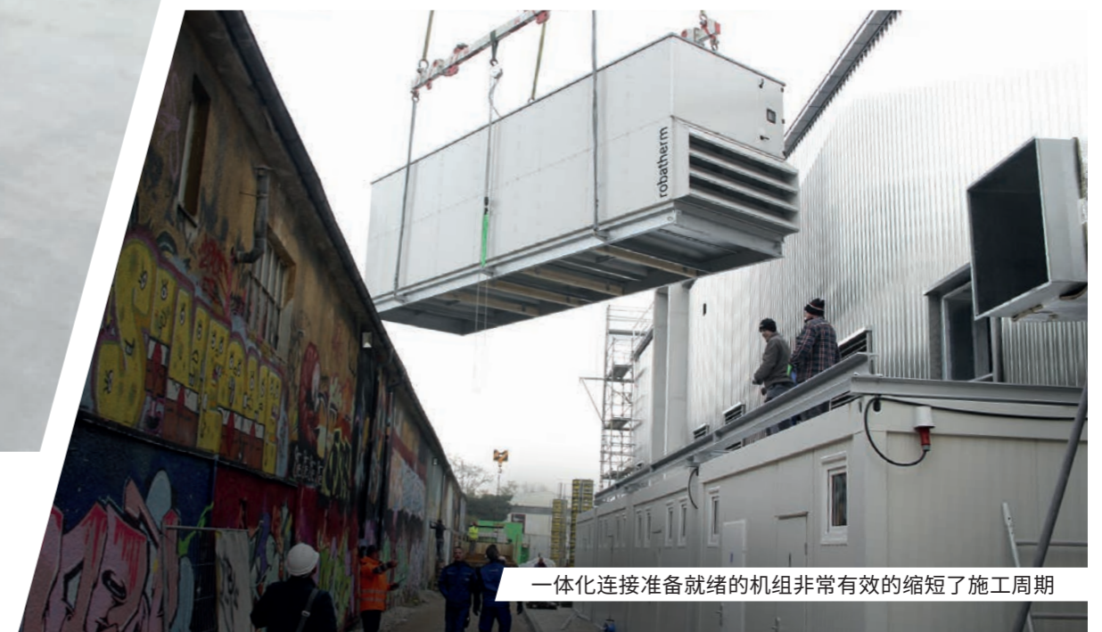
一体化连接准备就绪的机组非常有效的缩短了施工周期