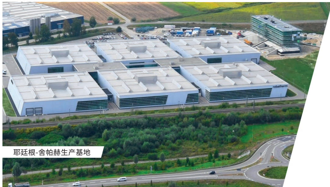
耶廷根-舍帕赫生产基地

恪守信念，勇于创新，不断进步 量身定制，精益求精，环境友好 百年企业，工匠精神，与时俱进