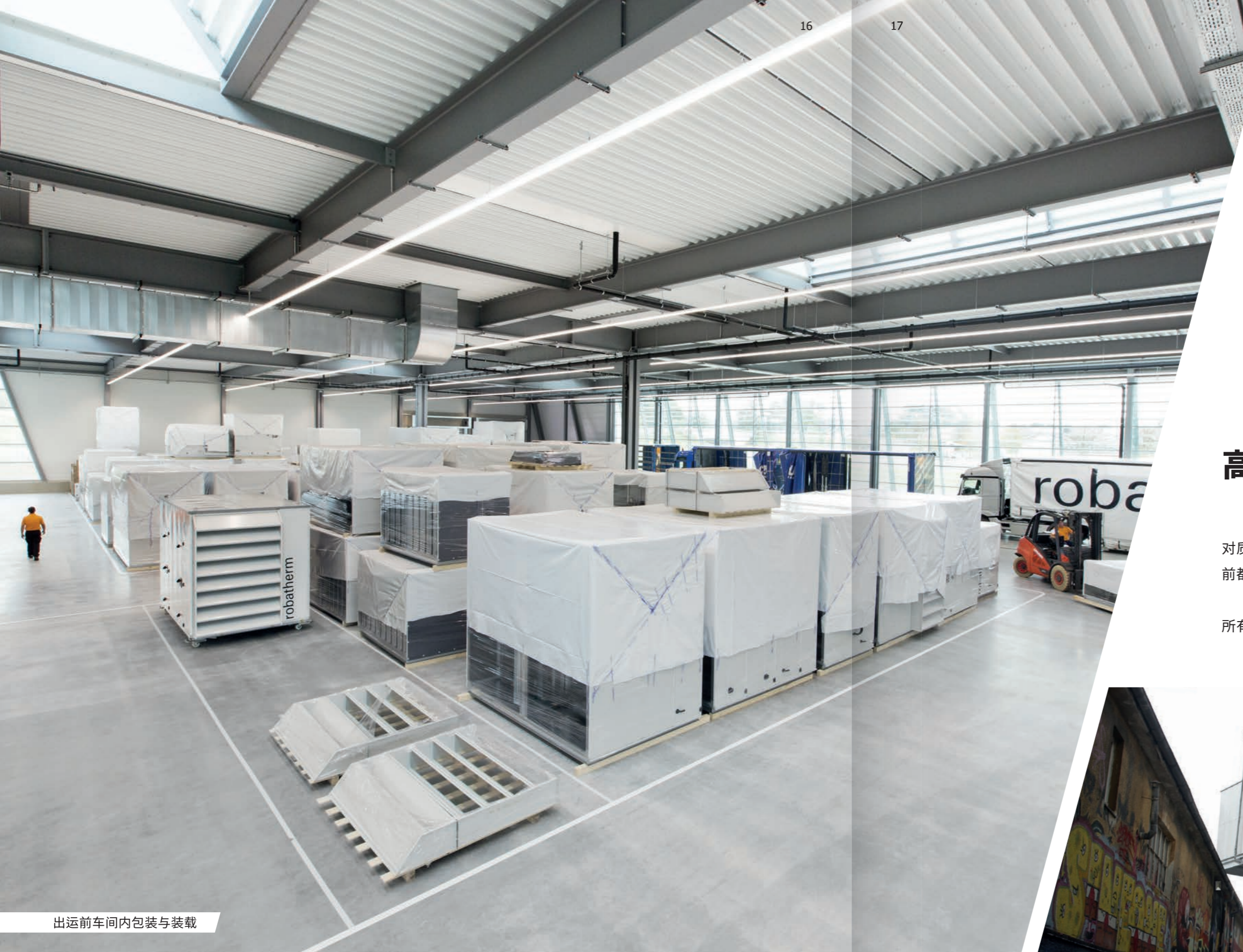
出运前车间内包装与装载